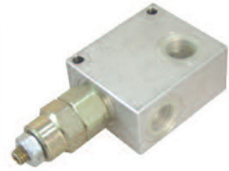
Material: cuerpo aluminio