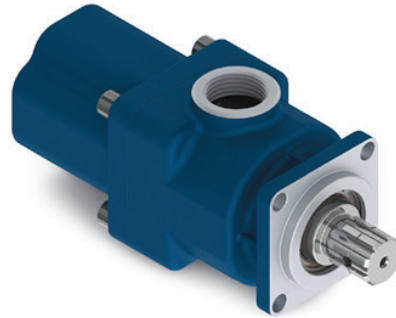
Tabla 1 - Datos Técnicos