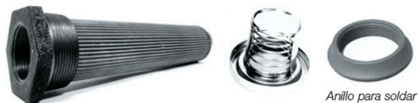
Anillo para soldar

Filtro lavable montaje lateral en tanque. Caudal hasta 800 Lts/min. Malla 150 micrones. Requiere de anillo soldable o cupla para montar